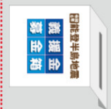
義援金箱フオーマツト①