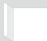
義援金箱フオーマツト②