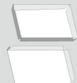
義援金箱フオーマツト③